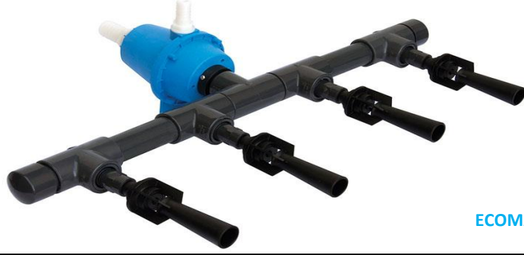
ECOMAT DALGIÇ HAVALANDIRICI