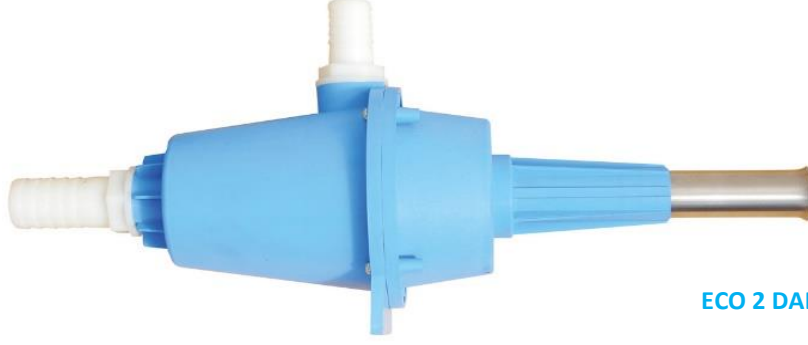
ECO 2 DALGIÇ HAVALANDIRICI